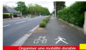
Organiser une mobilité durable

Extrait du bulletin communal de la commune de Veigné (37) présentant les aménagements pour la mobilité durable dans le cadre de la révision du PLU*