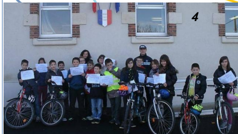
Formation à la sécurité routière pour les CM2 dans la commune de Chavagnes-les-Redoux (85)