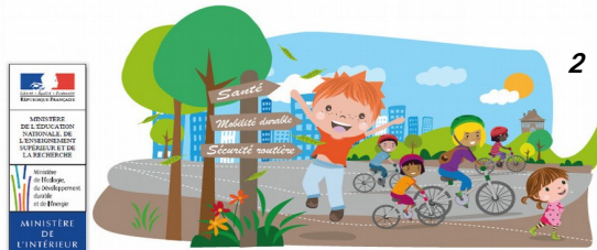
Bannière pour la "semaine du vélo" sur Eduscol