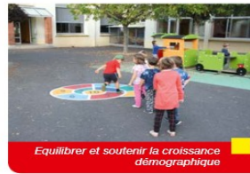
Equilibrer et soutenir la croissance démographique