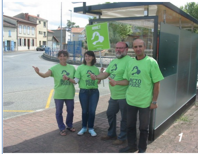
Des élus locaux mobilisés pour promouvoir Rézopouce, premier réseau d'autostop en France, à Moissac dans le Tarn-et-Garonne (82)