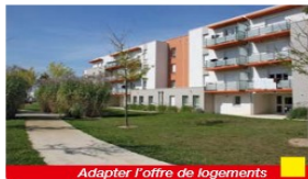
Adapter l'offre de logements