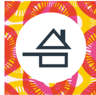
Sur fond perturbé