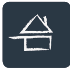
Reproduit à la main