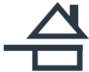
Sur fond clair