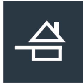
Sur fond sombre