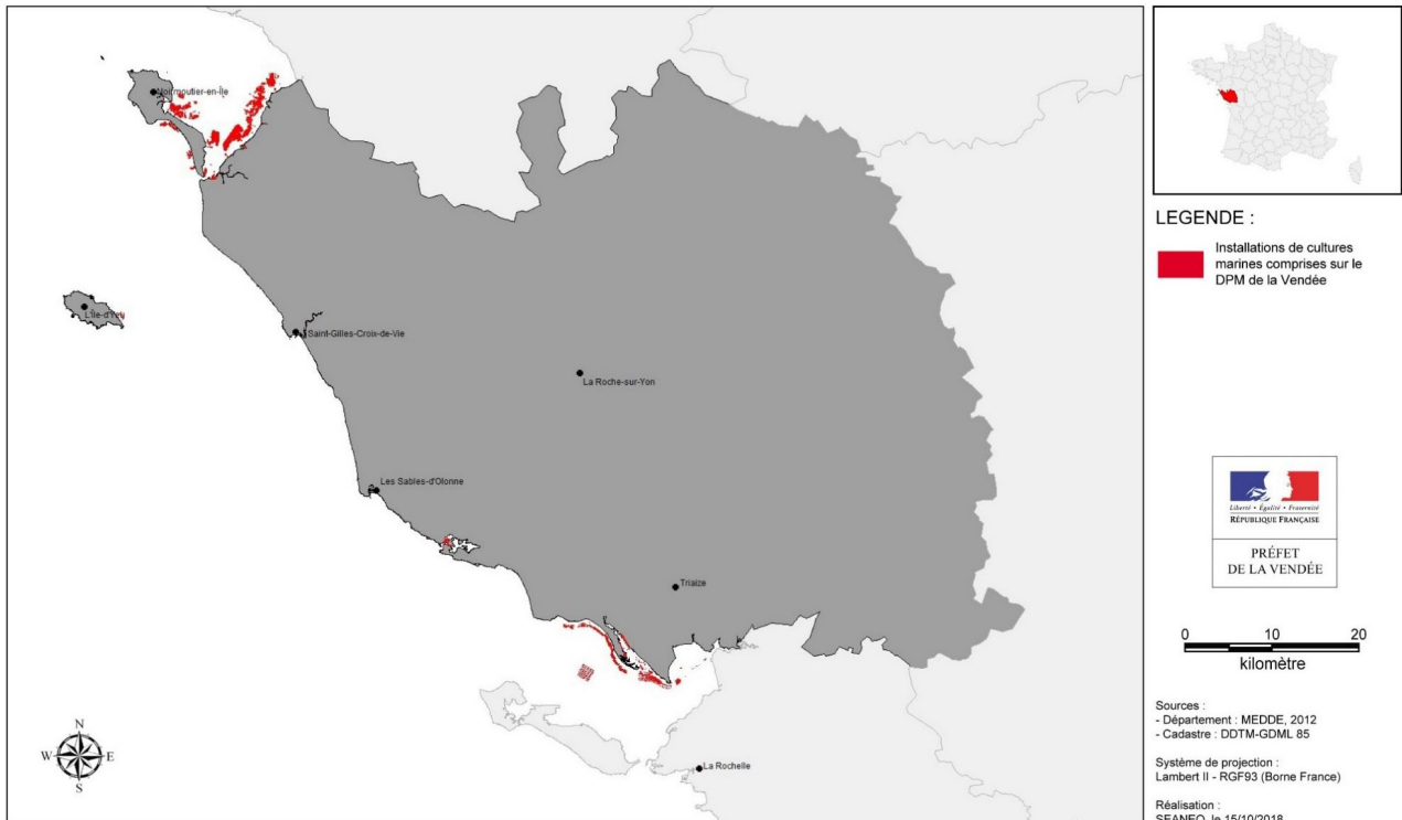
Figure 1: Localisation des activités de cultures marines sur le DPM (carte extraite du dossier)

Le littoral vendéen est essentiellement concerné par la culture d’huîtres et de moules, qui occupent à elles deux environ 600 hectares de surfaces concédées, réparties entre 4 000 concessions localisées principalement au nord et au sud.