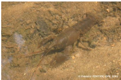
Écrevisse à pieds blancs

Dans le cadre d'une étude en cours sur la situation de l'Écrevisse à pieds blancs ( Austroptamobius pallipes ) en Vendée, les services de l'OFB ont effectué une prospection le 15 juillet 2020 sur le sous bassin versant du Margon (commune de la Flocellière). Le résultat de cette prospection est très préoccupant : aucune écrevisse n'a été observée sur cette station, pourtant connue comme étant celle abritant la plus grosse population du département. De nouvelles prospections en septembre 2020 ont mis en évidence un colmatage important du substrat par des particules fines (vase et limons). D'autre part, les résultats de l'IBGN indiquent une dégradation globale de la qualité du peuplement d'invertébrés et des habitats présents dans le cours d'eau (note de 5/20 en 2020 contre une note de 15/20 en 2016). Une sonde thermique a été installée en 2020 afin de connaître les températures de l'eau au fil de l'année. Des investigations complémentaires sont prévues en juin 2021 afin d'affiner les différentes hypothèses.