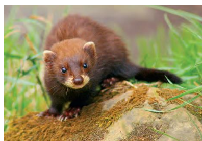
Vison d'Europe (Libre de droit)

Dans le cadre du Plan National d'Action (PNA) co-animé par l'OFB au niveau national, une campagne de prospection a été lancée en 2016 pour une durée de 4 ans sur l'aire de répartition historique du vison afin d'améliorer les connaissances sur son aire de répartition. En Vendée, principalement dans le Marais poitevin, 35 campagnes de prospection ont été réalisées. Chaque campagne repose sur un protocole de suivi de 10 pièges qui sont relevés pendant 10 nuits successives. Depuis 2017, un gros effort de prospection a été réalisé par les agents du SD 85 qui ont achevé en 2020 l'intégralité du suivi. Ces suivis n'ont pas permis de mettre en évidence la présence du vison d'Europe dans les secteurs prospectés.