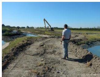
Contrôle travaux en zone Natura 2000

- Temps agent : 60% police de l'environnement et 15% connaissance et expertise.