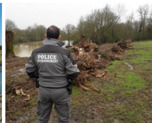
Contrôle arrachage de haie