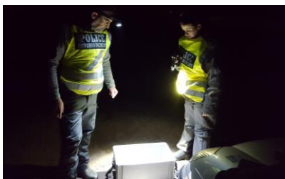
Contrôle civelle