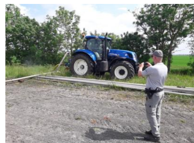
Contrôle pendant le confinement

Au total, 42 atteintes à l'environnement ont ainsi pu être constatées par les inspecteurs de l'environnement de l'OFB sur cette période de confinement soit 1/3 des infractions relevées en 2020. Plusieurs usagers contrôlés nous ont précisé qu'ils ne pensaient pas que les milieux ruraux et forestiers vendéens feraient l'objet des surveillances particulières par la police de l'environnement lors de ce confinement.