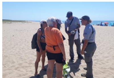
Sensibilisation du grand public

Le gravelot à collier interrompu est un petit oiseau protégé qui niche sur le haut des plages. Très discret, il se confond avec son environnement et pose ses œufs à même le sol. Les agents du sd 85 ont, au printemps et en été, sensibilisés les plaisanciers à l'espèce et à l'importance de protéger les oiseaux et leurs habitats en suivant quelques règles : marcher sur le sable mouillé, tenir les chiens en laisse, éviter les hauts de plage et les dunes, rester à distance des nids et des oiseaux. L'objectif est de limiter la destruction des nids et le dérangement des couples en période de reproduction. Cette campagne a été très appréciée des plaisanciers et des locaux.